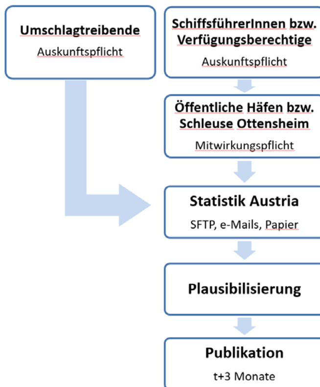
Abbildung 2: Güterverkehr – Ablauf der Datenübermittlung

Im Jahr 2019 übermittelten von den 14 Meldestellen zehn die Daten per E-Mail, eine Meldestelle nutzt bereits die neue Möglichkeit der Datenübermittlung per Schnittstelle. Der neue Datensatz wird dabei von zwei Meldestellen verwendet. Die restlichen drei Meldestellen übermitteln die Ergebnisse weiterhin mittels Papierformular.