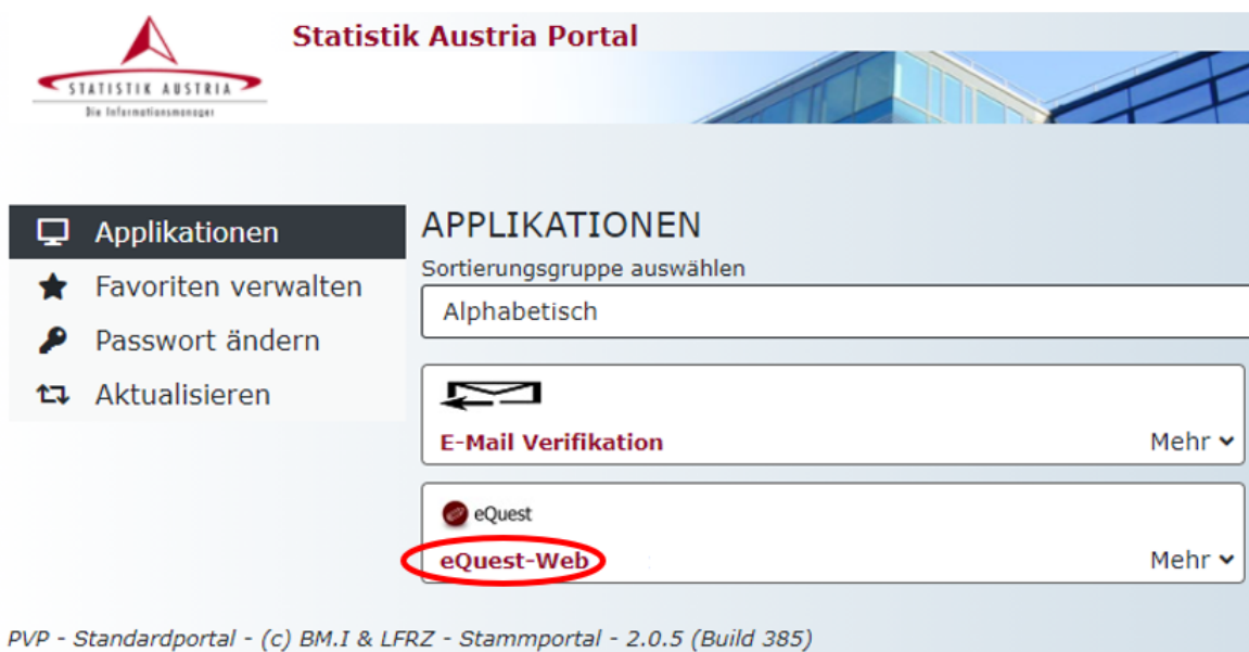
Abbildung 1 Bildschirmansicht nach erfolgreicher Anmeldung im Portal

Nach erfolgreicher Anmeldung wählen Sie bitte unter APPLIKATIONEN eQuest-Web , um zur Fragebogen-Auswahl zu gelangen (siehe Abbildung 1).